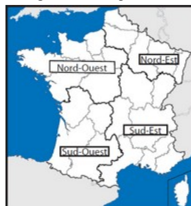
Tableau de répartition

Zone Nord Ouest : Bretagne, Ile-de-France, Basse et Haute Normandie, Centre, Pays de la Loire.